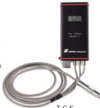
T. C. S.